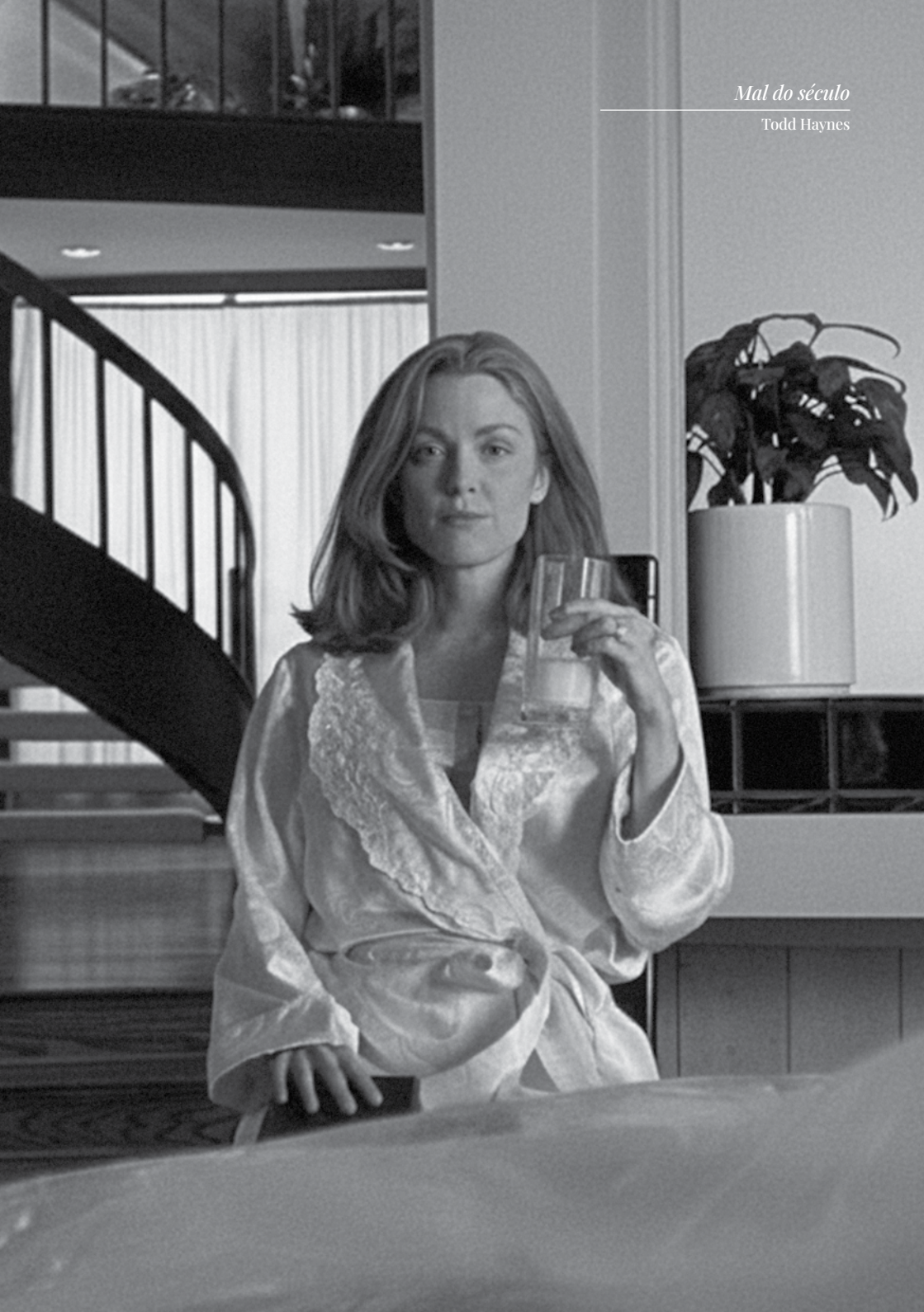
Mal do século Todd Haynes