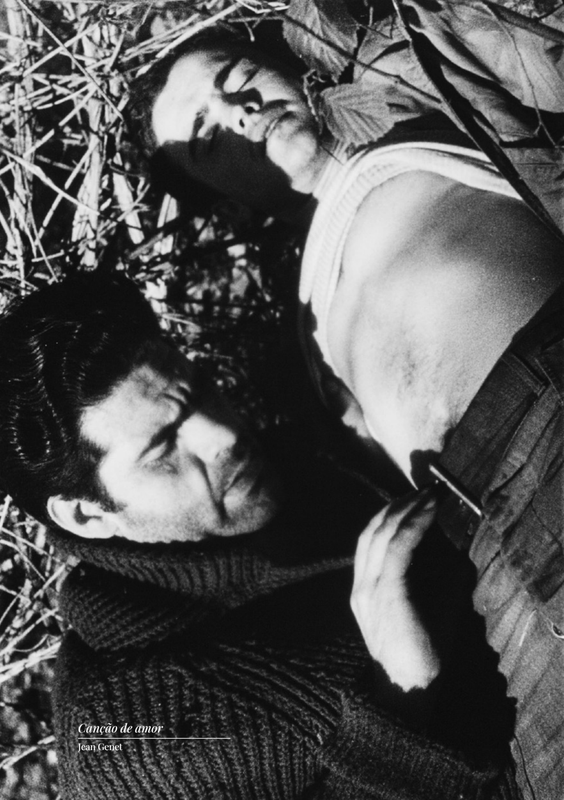
Canção de amor Jean Genet