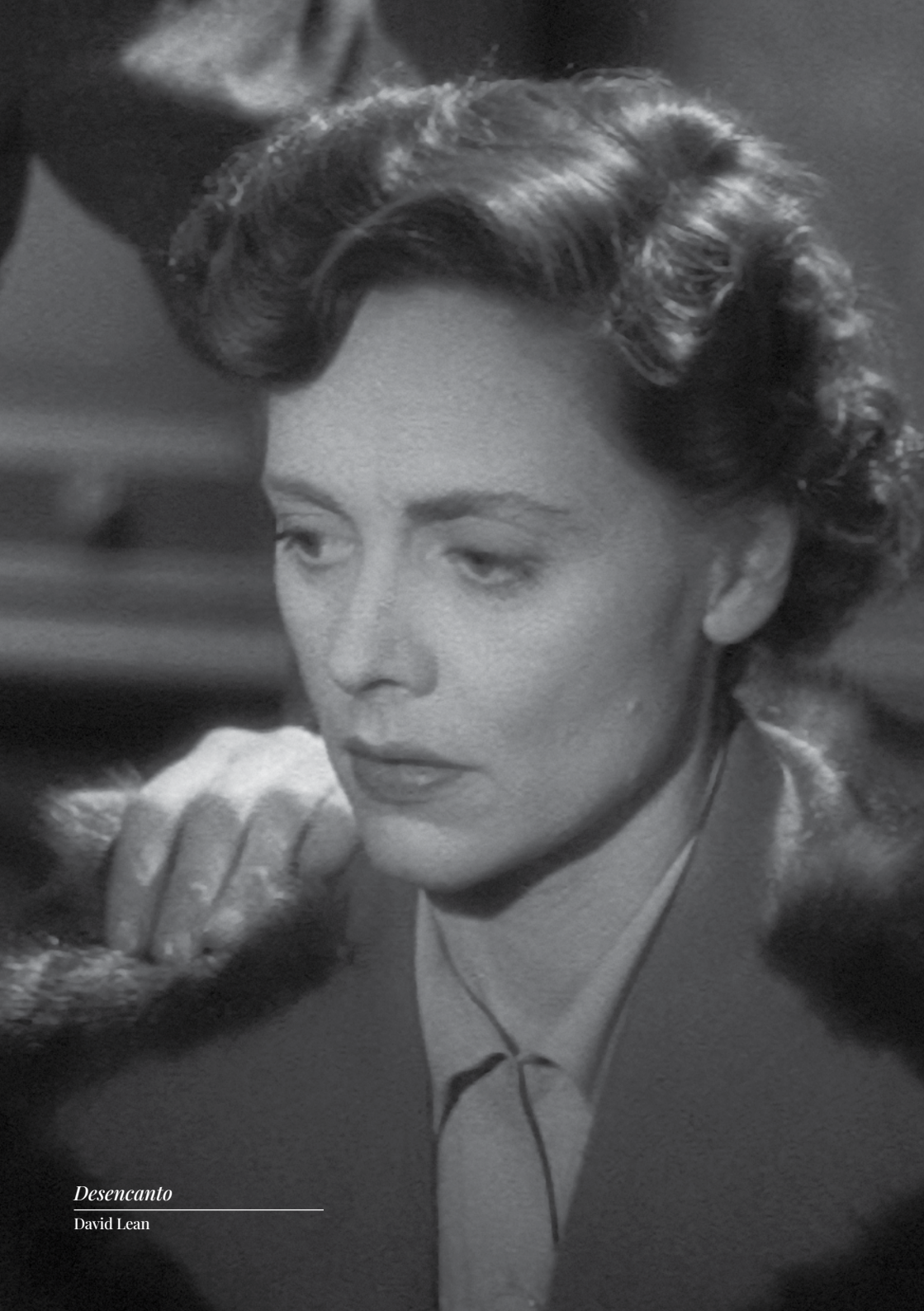
Desencanto David Lean