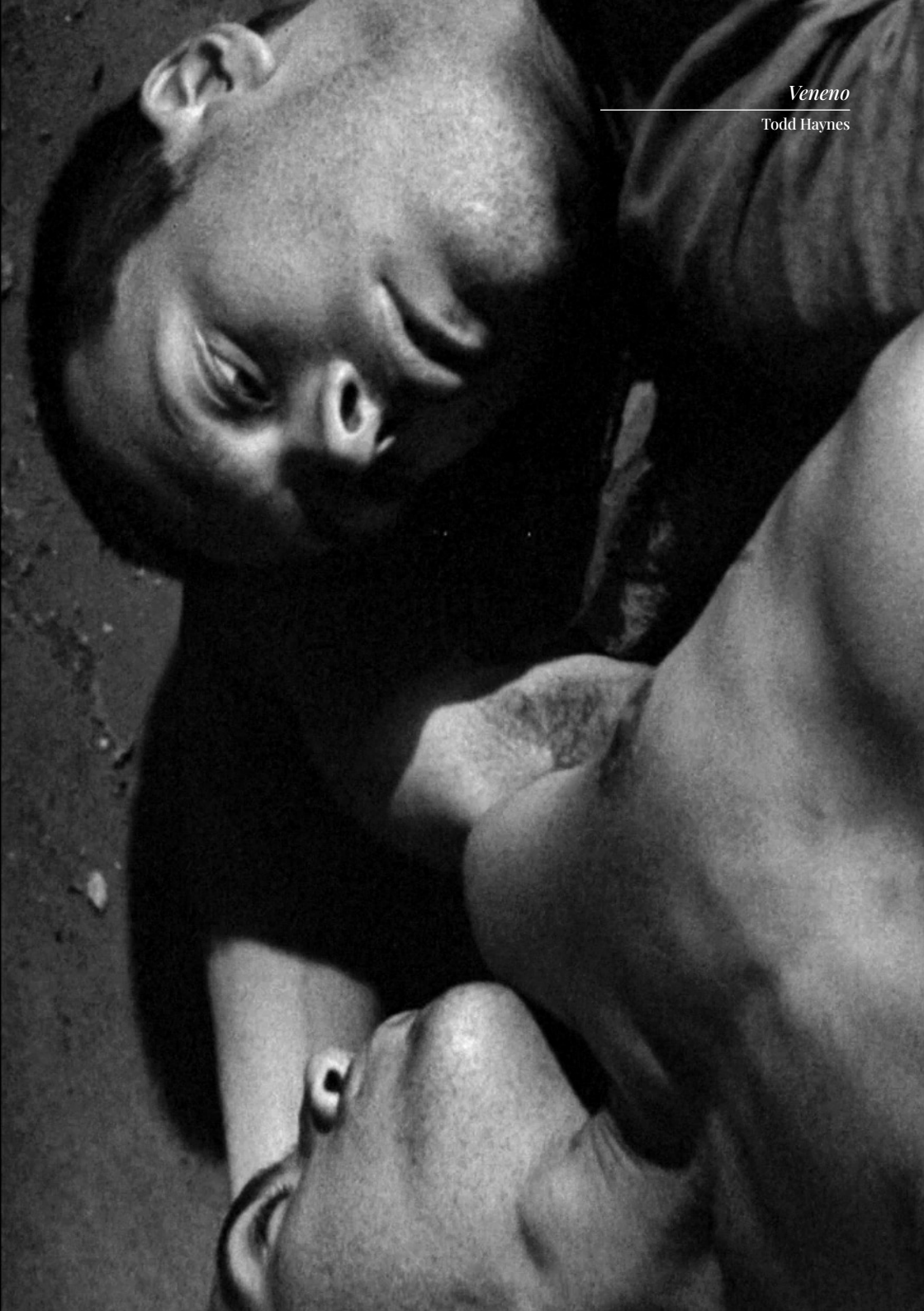
Veneno Todd Haynes