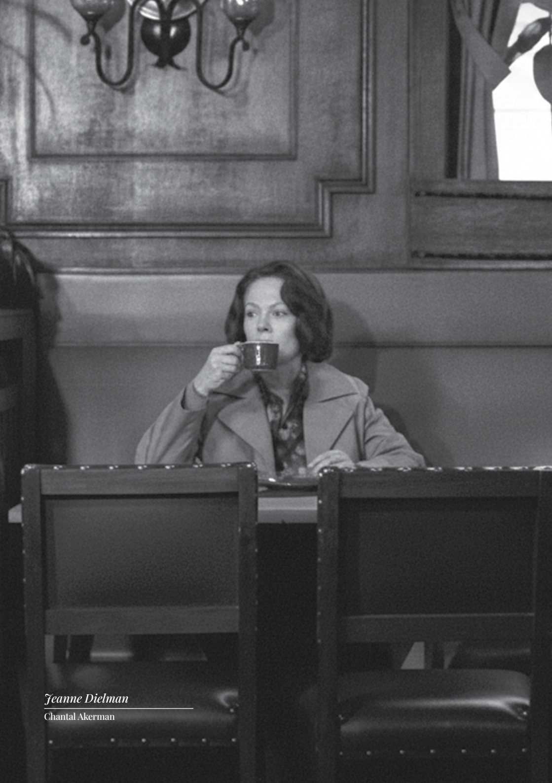
Jeanne Dielman Chantal Akerman